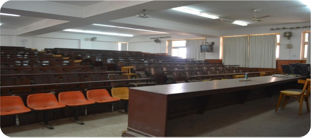
قاعة تدريس بالكلية