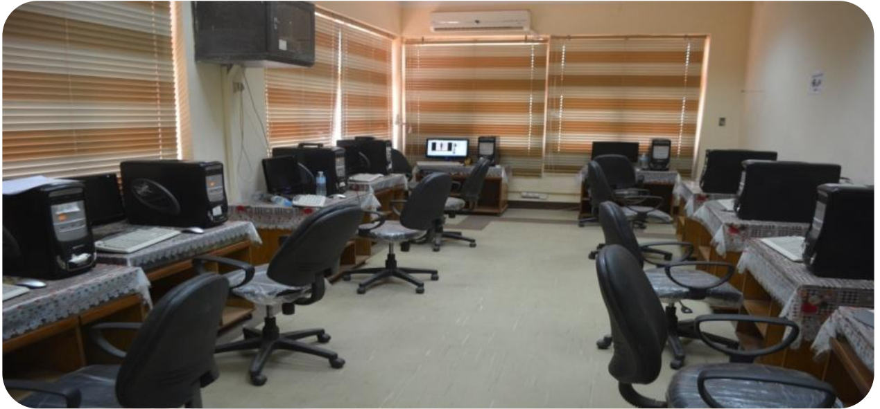
من داخل أحدى المعامل بالكلية