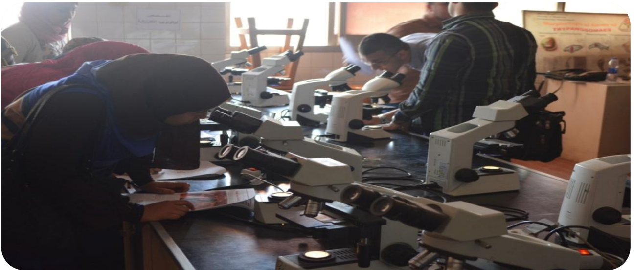
من داخل أحدى المعامل بالكلية