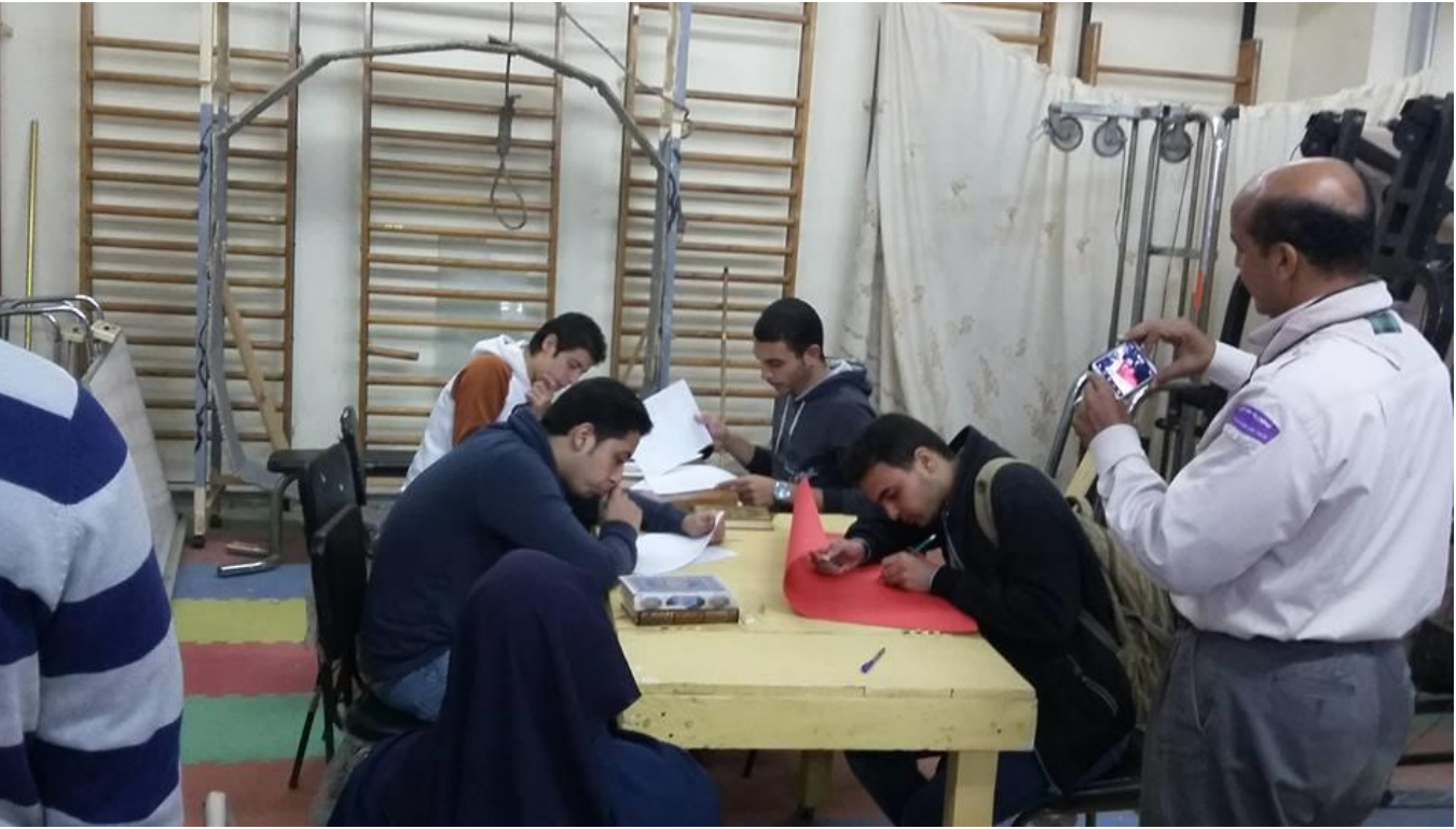
7- معسكر تدريب عشيرة جواله الكلية على التعريف بالجواله الاربعاء 2016/11/30