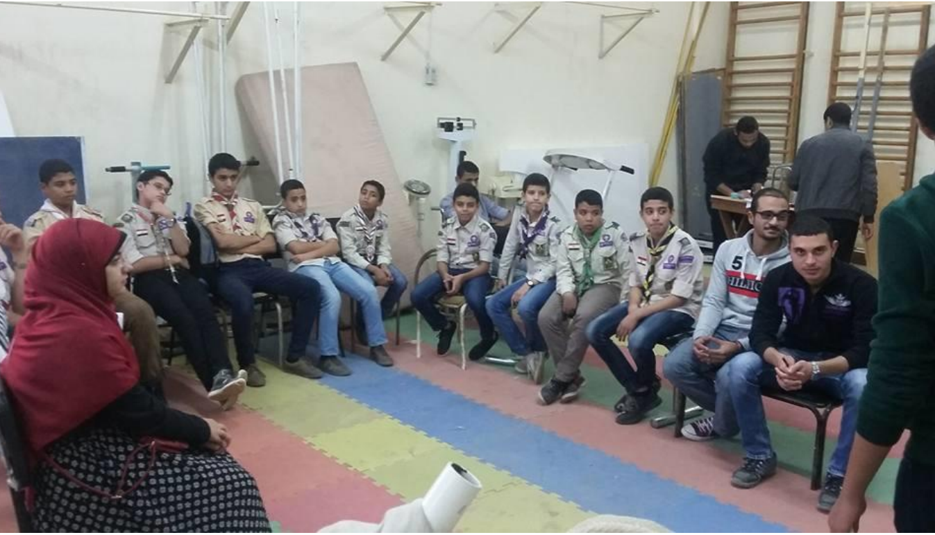
6- المشاركة فى إختيار عشيرة جواله الجامعة بتاريخ الأحد 27 / 11 / 2016 م