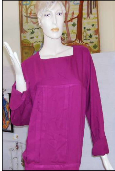
صورة "البلوزة" التي قامت الطالبات بتنفيذها