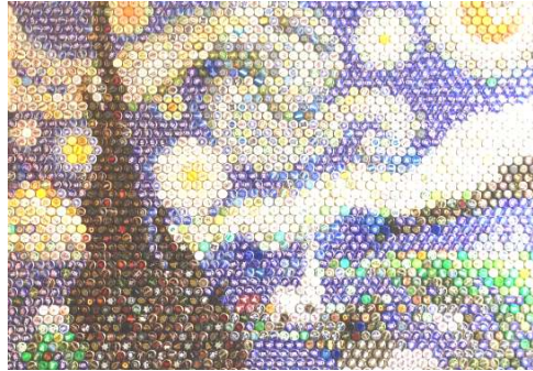
شكل (١- أ) اعادة الصياغة- بفن الخرده