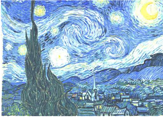
شكل (١) لوحة (ليل مرصع بالنجوم Starry night) عام ١٨٨٩ م ، للفنان (فان جوخ (Van Gogh)

وفيما يلي عرض لعدد من الأعمال التصويرية المعاصرة واعاده صيغتها بفن الخرده شكل (١) لوحة (ليل مرصع بالنجوم Starry night) للفنان (فان جوخ-Van Gogh)، تم صياغتها باساليب متنوعة لفن الخرده شكل (١- أ،ب،ج) ، شكل (٢) لوحة (اشعة الشمس خلال الضباب The sun the fog shining through) وهي تصور البرلمان في لندن للفنان (كلود مونييه Claude Monet-) وتم صياغتها بالخرده شكل (٢- أ) ، وايضا لوحه بركة زنايق الماء (Water Lilies) للفنان كلود مونية شكل (٣) واعاده صياغتها بفن الخرده شكل (٣- أ،ب)، شكل (٤) عمل لفنان (هنرى ماتيس Henri Matisse-) ، وعادة صياغتها بفن الخرده شكل (٤- أ).