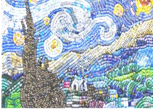
شكل (١- ج) اعادة الصياغة- بفن الخرده