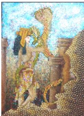
شكل (٦) عمل رقم (٢) للطالبة حسناء السيد شعبان ، توال خشب ٧٠X٦٠سم