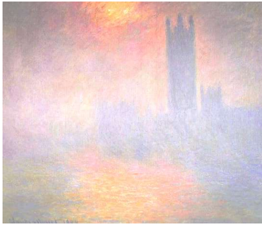
شكل (٢) لوحة (اشعة الشمس خلال الضباب (The sun shining through the fog) وهى للبرلمان فى لندن، عام ١٩٠٤ م ، للفنان (كلود مونييه Claude Monet-)