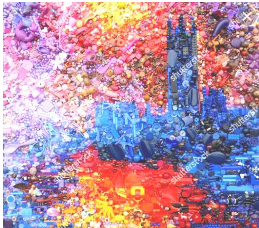
شكل (٢- أ) اعادة الصياغة- بفن الخرده