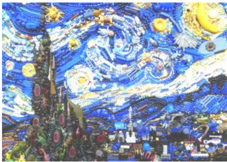
شكل (١- ب) اعادة الصياغة- بفن الخرده