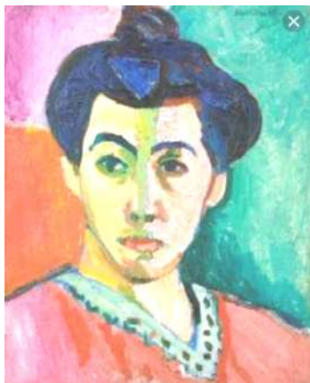
شكل (٤-أ) واعادة الصياغه بفن الخرده

شكل (٤) عمل لفنان (هنرى ماتيس-Henri Matisse) عام ١٩٠٥ م