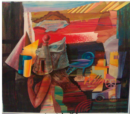
شكل ١ ( ج )