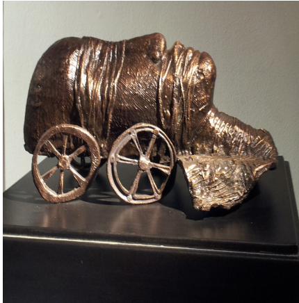
شكل ٣ (د) عمل نحتي للفنان مصطفى الرزاز يتضح به تأثير خامة القماش ومن أسفلها خطوط الشاش لتسهيل وصول المعنى وتحقيق قيم حركية متعادلة