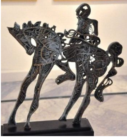
شكل ٣ (ب) أحد أعمال الفنان مصطفى الرزاز النحتية والتي اعتمدت على الإيقاع الخطي الدائري لخلق مساحات من الفراغ المتوازن