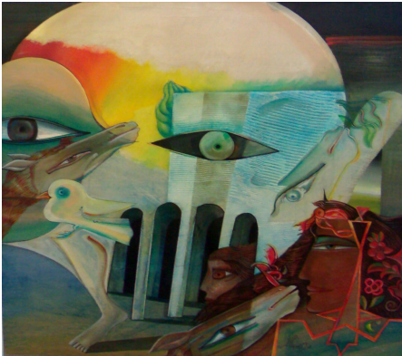
شكل ١ ( د )