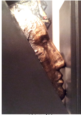
شكل ٢ (أ)