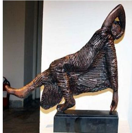
شكل ٣ (ج) نحت للفنان مصطفى الرزاز يعتمد على خامة المضافة ذات التأثير الخطي والتي تترك إيقاعاً حيويًا وقيم خطية وملمسية على سطح العمل

ونجد أن من خلال تحليل بعض الأعمال الفنية للفنان "مصطفى الرزاز" قد تحققت قيماً فنية وجمالية وبنائية والتي اتضحت من خلال تحقيق الأسس الإنشائية والجمالية والتي تمثلت من خلال تحقيق الإتران والوحده والتنوع في العمل الفني، وتحقيق التوافق والتناغم اللوني الذي تواجد في الأعمال الفنية، وتوزيع الفراغات بشكل مدروس في العمل الفني وتوزيع العناصر وتناولها بشكل متفرد يخدم دراما الموضوع في بناء تصميمي جيد، وتحققت قيماً ملمسية ولونية وحركية أثرت الأعمال الفنية سواء كانت سطحة أو مجسمة .