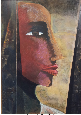
شكل ٢ (ب)