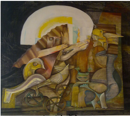
شكل ١ ( ب )