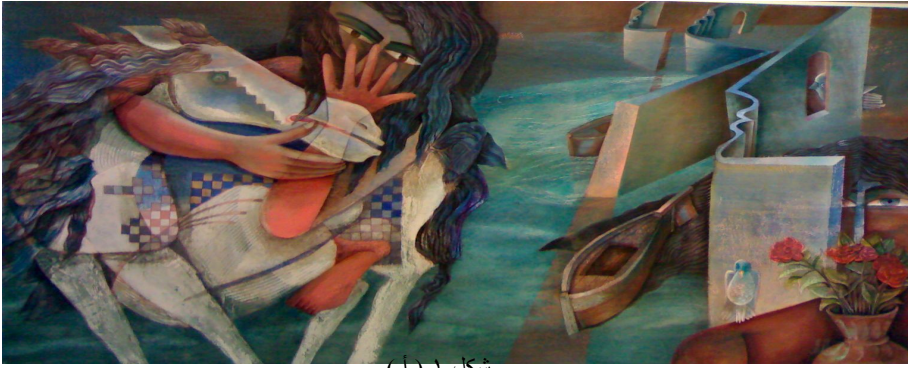
شكل ١ ( أ )