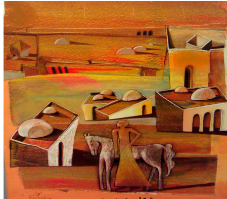
شكل ١ ( هـ )

شكل ١ ( أ ، ب ، ج ، د ، هـ ) بعض من الأعمال الفنية للفنان "مصطفى الرزاز" والتي يتضح بها عناصره المميزة التي صاغها داخل أطر أعماله في علاقات تشكيلية متناعمة ومتوافقة بأسلوب خاص وتكنيك أدائي ينم عن خبرات مهارية في تناول الخامة والتعامل مع المساحة وعلاقات المفردات والقيم اللونية والضوئية والبناء التكويني المتكامل.