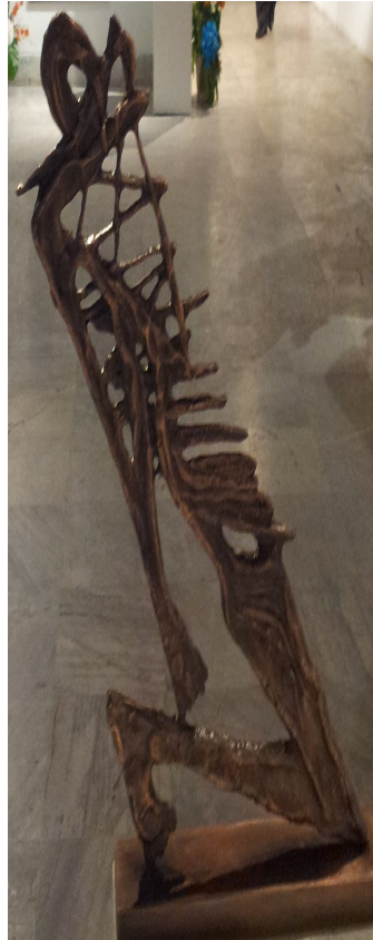
شكل ٢ (ج)

شكل ٢ ( أ،ب،ج،د ) مقارنه بصريه لإختلاف التناول التشكيلي والذي تفرضه طبيعة الخامه بين ثنائى الأبعاد وثلاثى الأبعاد لموضوع واحد ومدى تأثير هذا التناول على المدرک الشكلى لمفهوم كل عمل والتحول فى العلاقات الخطية والفراغية والملمسية واللونية والضوئية وما يتبع كل ذلك من قيم فنية تنشئ العمل التصميمى سواء مسطح أو مجسم فكلأ منهما يحتوى على إر هاصات فكرية تتجلى فى التناول والمعالجة التى تفرضها طبيعة الخامه.