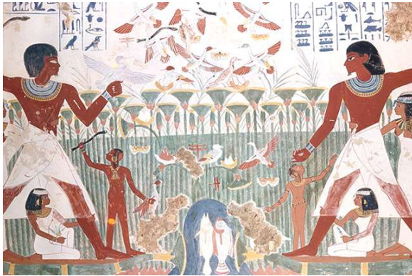
صورة ( ٢ ) احد مشاهد الصيد ٤