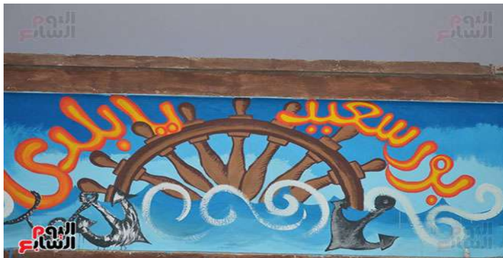
صورة رقم (١٢)