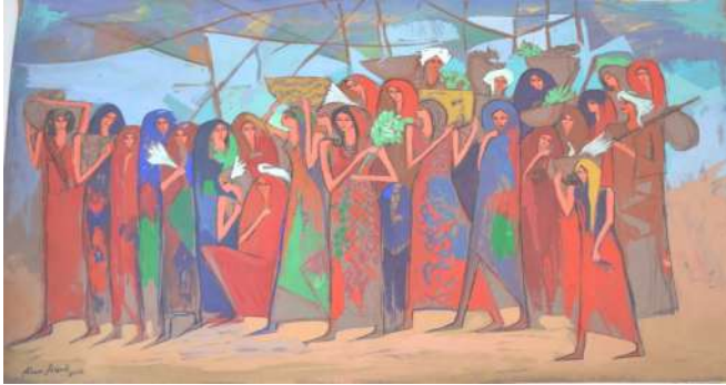
صورة رقم (٧) اعمال فنية للفنان علاء صبري

يعد ( علاء صبري* ) ٨ "فنان يعرف كيف يستفيد من تراثه الثقافي والفني المتعدد والمتنوع في غناه وفرادته ، خصوصاً توظيفه واستلهامه التراث المصري القديم ، ولعل الملايين في مصر وبلدان العالم ، قد عرفوا فنه التصويري الجنائزي" ٩