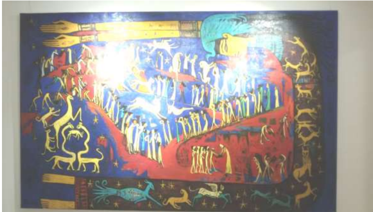
صورة رقم (٨) اعمال فنية للفنان علاء صبري

يعد ( علاء صبري* ) ٨ "فنان يعرف كيف يستفيد من تراثه الثقافي والفني المتعدد والمتنوع في غناه وفرادته ، خصوصاً توظيفه واستلهامه التراث المصري القديم ، ولعل الملايين في مصر وبلدان العالم ، قد عرفوا فنه التصويري الجنائزي" ٩