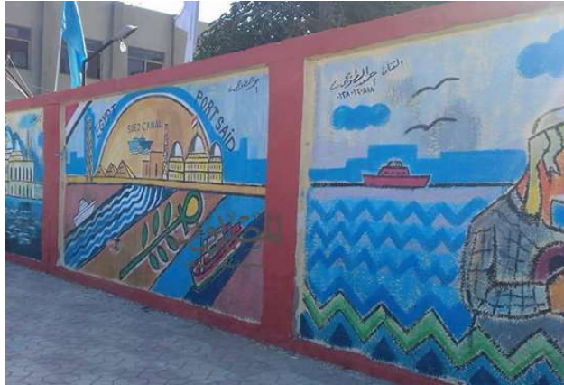
صورة رقم (١٥)