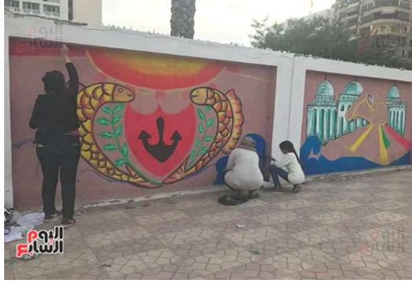
صورة رقم (١٣)