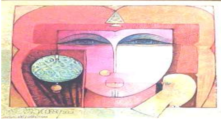
صورة رقم (٨) لوحة فنية للفنان حبيب جورجى

"في عام ١٩٣٨ كانت الريادة لجماعة فنية والتي أسسها الرائد حبيب جورجى واعتمد هذا الفن على منظور مختلف يستمد قوته من التراث." ١٠ ف نجد ان التراث المصري زاخر بالقيم التشكيلية والتعبيرية التي يمكن ان يستلهم منها الفنانين عبر عصور متعددة و مختلفة ، فكان هذا محركاً لي كباحث الي تاصيل الهوية المصرية في التصوير . لما يتفق مع الاستراتيجيات القومية .