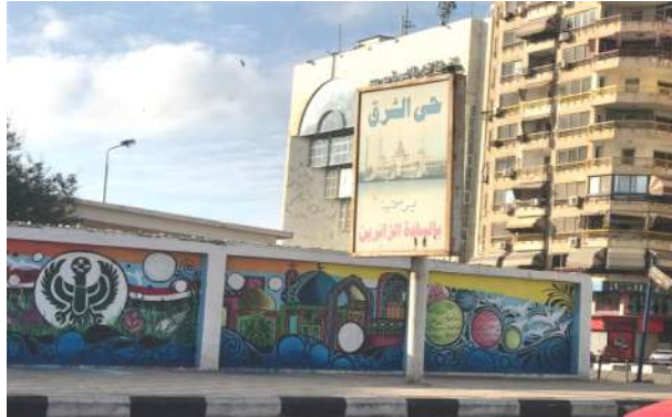
صورة رقم (١٤)