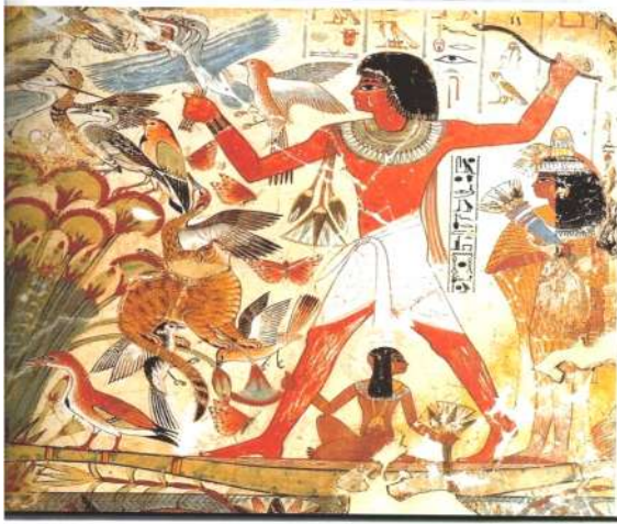
صورة رقم ( ١ )

والقضاة ورؤساء الخدم وقاده الجند والكتبة والمشرفين علي الأملاك والمصانع والمصريين والمثاليين ، ونري كل هؤلاء وهم يؤدون وظائفهم الدنيوية. " (٢١)