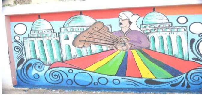
صورة رقم (٩)