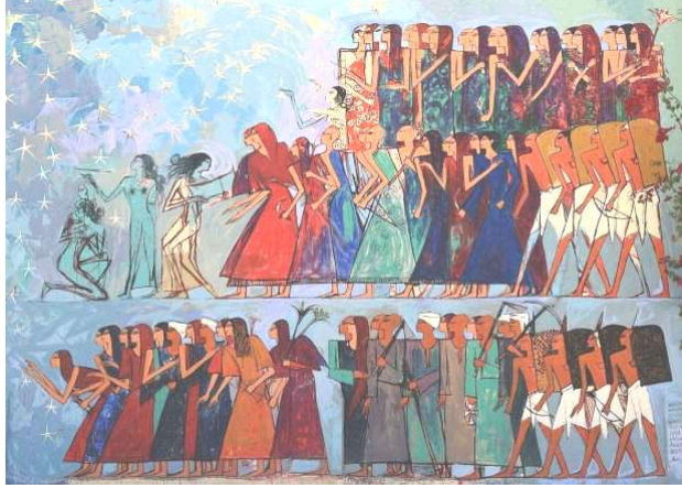
الصورة رقم (٦) اعمال فنية للفنان علاء صبري