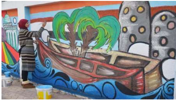
صورة رقم (١١)