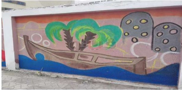
صورة رقم (١٠)