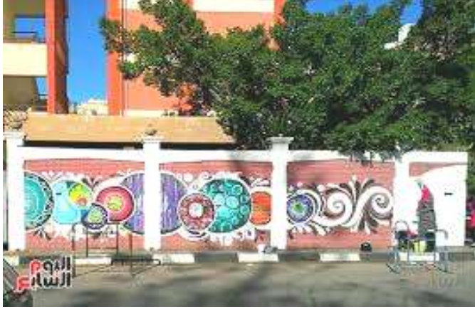
صورة رقم (١٦)