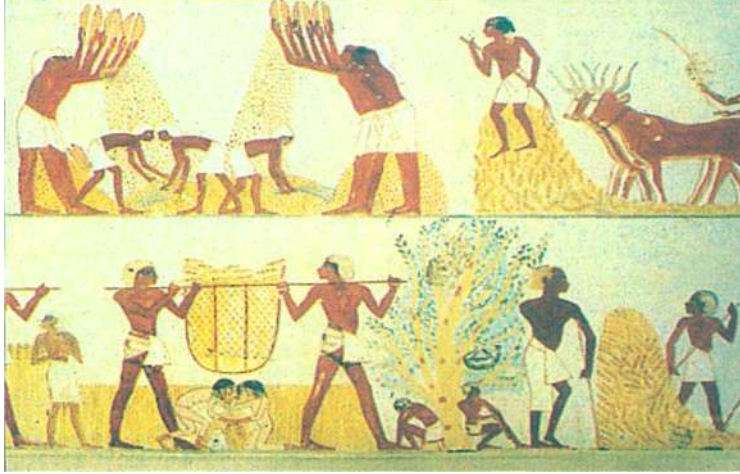
صورة رقم (٣)