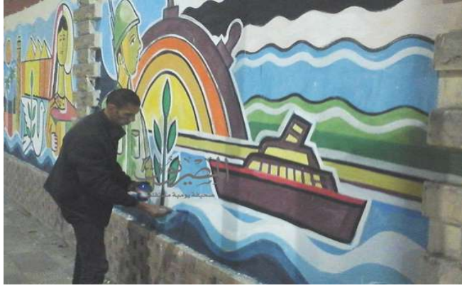
صورة رقم (١٧)