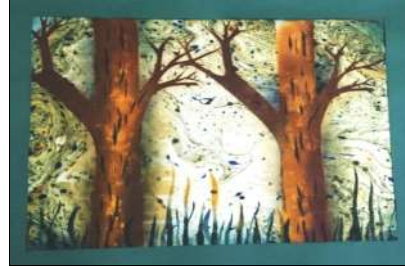
نوع العمل: معلقة