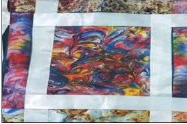
نوع العمل: غطاء لوسادة