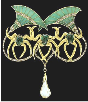
شكل ( ٨ ) ١ عمل الفنان : Emmanuël-Jules أيمانويل جوليس 1900 نوع المشغولة : قلادة صدر الخامة المستخدمة : الذهب ،المينا، اللؤلؤ، أحجار كريمة