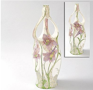
شكل رقم (٤) الفنان: Rozenburg 1900 روزميرج المانيا الأبعاد: ارتفاع "17 القطر 6"