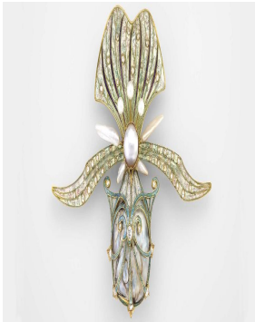
شكل ( ٩ ) ١ عمل الفنان : Georges.fauquet جورج فوكيه 1901 نوع المشغولة : قلادة صدر الخامة المستخدمة : ذهب ،مينا، لؤلؤ ، ماس