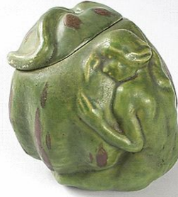
شكل رقم (٢) الفنان: Rupert Carabin روبرت كارين ١٩٠٠ باريس الأبعاد: القطر 5 1/2 × 5 1/4 ارتفاع من كتالوج Macklowe الفن الجديد