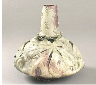
شكل رقم (٥) الفنان: Ernest Bussière ارنست بوسير 1900 باريس أبعاد: 18 ارتفاع × 16 القطر

"يرجع الفضل في ذلك للعديد من مصمميها منهم رينيه لايك ReneLalique"، جورج فوكيه "GorgesFoket"، هنري فيفر "Henri Vever"، فيليب ولفرز "philippewolfers"، الفونس موكا "Alphonse Mucha"، أرشيلد كنوكس "Archibald Knox"، جورج جينسن "George Jensen" والأشكال من (٦: ١١) تمثل أعمال بعض هؤلاء الفنانين حيث تميزت تصميماتهم بالخطوط المعقدة ذات الانسيابية الحركية، وكذلك استخدام العناصر الطبيعية، النماذج النباتية، الأشكال الأنثوية والتي غالبا ما كانت بالغة الدقة، والاهتمام بالتفاصيل والتقنية ذات المهارة العالية.