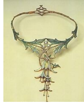
شكل ( ١٠ ) ١ عمل الفنان: Georges.fauquet جورج فوكيه 1905 نوع العمل: قلادة صدر الخامة المستخدمة: ذهب ،مينا،ماس،أوبال،لؤلؤ ١

القديمة بالإضافة إلى فنون الشرق الأقصى والفنون الزخرفية الأفريقية فنجد أن رواد تلك الحركة حققوا تحولا جديدا عن القواعد التصميمية التقليدية فاعتمدوا على محاور أساسية ارتكزت عليها فلسفتهم، كما استقوا عناصرهم التشكيلية من مجموعة مصادر فنية متنوعة