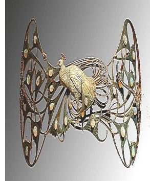
شكل رقم ( ٦ ) عمل الفنان : Rene Lalique رينيه لاليك 1898-1899 نوع المشغولة : دبوس صدر الخامة المستخدمة : ذهب ،مينا، حجر الأوبال