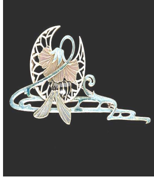
شكل رقم ( ٧ ) ١ عمل الفنان : G.fauquet جورج فوكيه 1901 نوع المشغولة : دبوس صدر الخامة المستخدمة : ذهب ،مينا