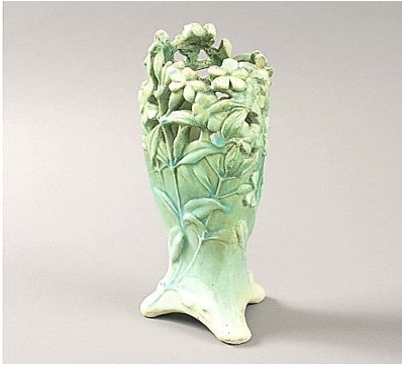
شكل رقم (٣) الفنان : Edmond Lachena ادمونت لاشناس 1910 باريس الأبعاد: 9 ارتفاع