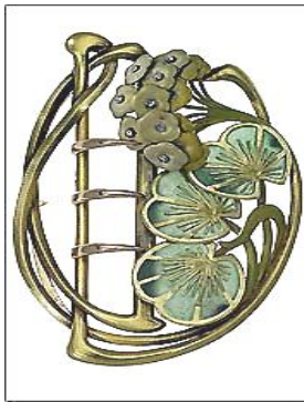
شكل ( ١١ ) ١ عمل الفنان: Henri Vever هنري فيفر 1900 نوع العمل: توكة حزام الخامة المستخدمة: ذهب ،مينا،ماس ٢