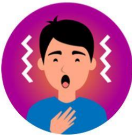
صعوبة في التنفس