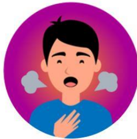
ضيق في التنفس