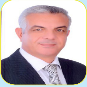
بقلم : أ.د/ عادل السيد مبارك رئيس الجامعة