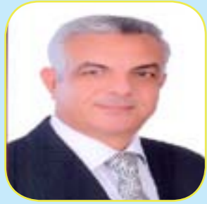
بمقام : أ.د/ عادل السيد مبارك رئيس الجامعة

بسم الله الرحمن الرحيم يسعدني اليوم أن أقدم هذه الكلمة الافتتاحية للنشرة الدورية لقطاع خدمة المجتمع وتنمية البيئة حيث تجدون في هذا العدد المتميز تنويراً عن إفتتاح كلية الإعلام ومبنى كلية طب الأسنان، وهما يمثلان صرحين عملاقين جديدين لجامعة المنوفية. تجدون أيضاً توصيات مجلس شؤون خدمة المجتمع وتنمية البيئة على أهمية الإستمرار في إتخاذ التدابير الاحترازية الضرورية للوقاية من جائحة كورونا وتفعيل شعار الوقاية خير من العلاج، وكذلك على ضرورة الاستغلال الأمثل للوحدات ذات الطابع الخاص بالجامعة والتي يبلغ عددها ٢٧ وحدة من خلال التفكير خارج الصندوق التقليدي لهذه الوحدات.